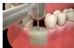
Mise en place de l'implant