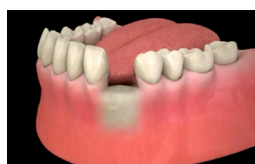
Accès au site

Une anesthésie locale est réalisée. La gencive est incisée et dégagée pour avoir accès au site osseux où la pose de l'implant est prévue. Le passage successif de forets de différents diamètres permet de préparer le logement dans lequel l'implant est ensuite mis en place.